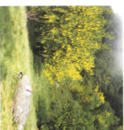
Una pietra singolare

La «Caldera», costruzione in sasso (recentemente riattata) per misurare le precipitazioni. L'acquedotto scavato nella roccia di Cortacco; il masso con incisioni rupestri all'Alpe Avisioia; il diamante di sasso poco sotto la capanna serviva da riparo per le guardie doganali.